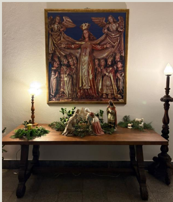
Presépio Hall da Administração