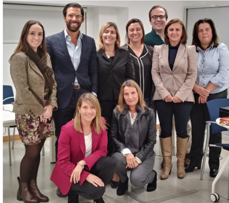
2. In Company – Novembro 2018