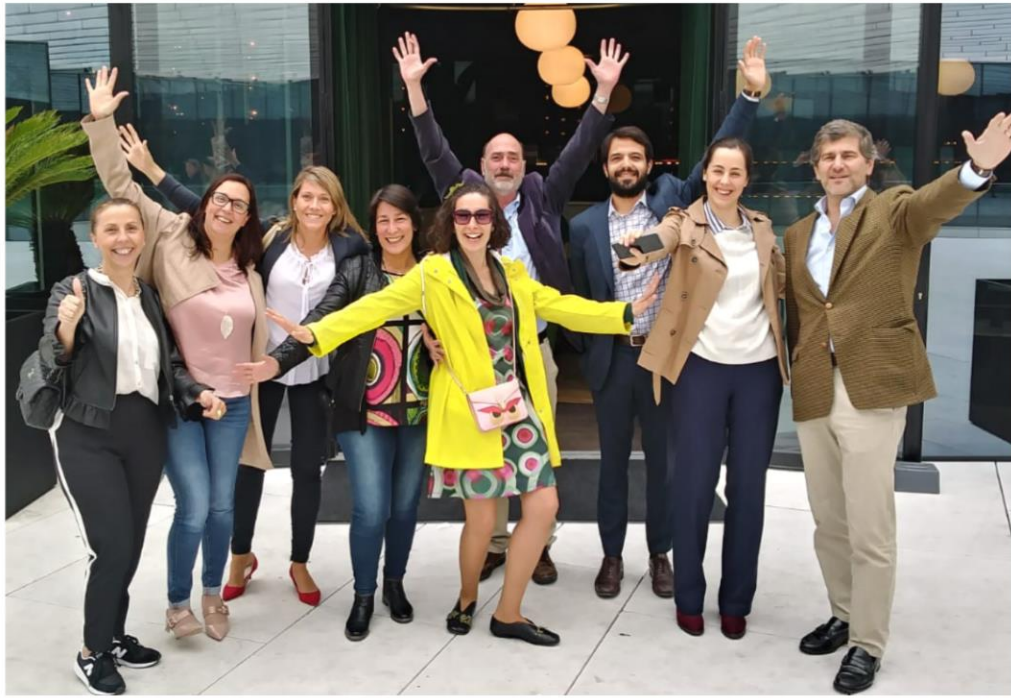
1. Junho 2018